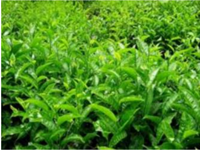
Figura 1: Indarti et al. , 2019.